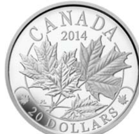
캐나다 메이플 은화 앞면