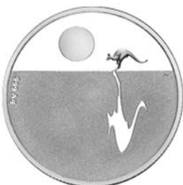
호주 캥거루 은화 앞면