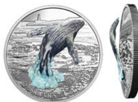
필름 부착형 은화