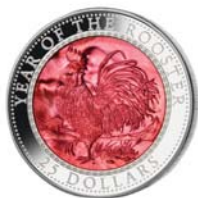
자개 부착 은화