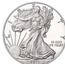
미국 이글 은화 앞면