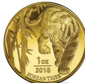
호랑이 불리온 메달 앞면