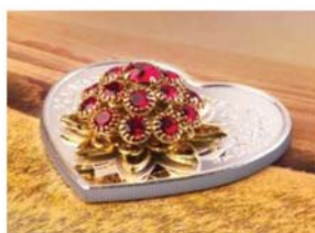
루비 부착 은화