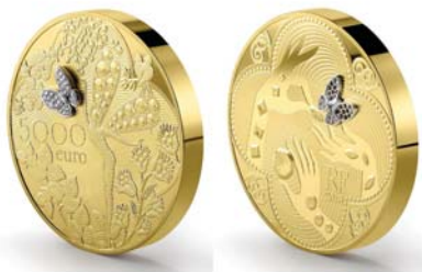
다이아몬드 삽입 금화