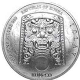
2016 치우천왕 메달 공통앞면