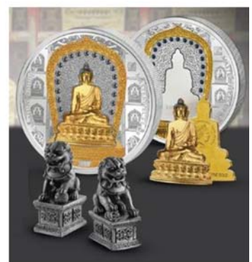
결합형 금 · 은화