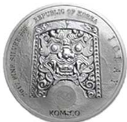
2017 치우천왕 메달 공통앞면