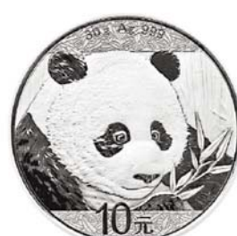
중국 판다 은화 앞면