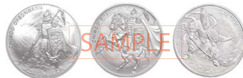
시리즈 제품화 가능

❻ 제품에 대한 상세한 설명과 제작 방법 등 부가적인 내용을 자유롭게 기술합니다. (내용이 많을 경우 별도 양식 추가 가능)