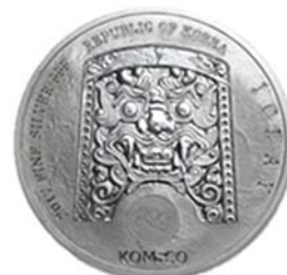
2017 치우천왕 지신 메달 공통앞면