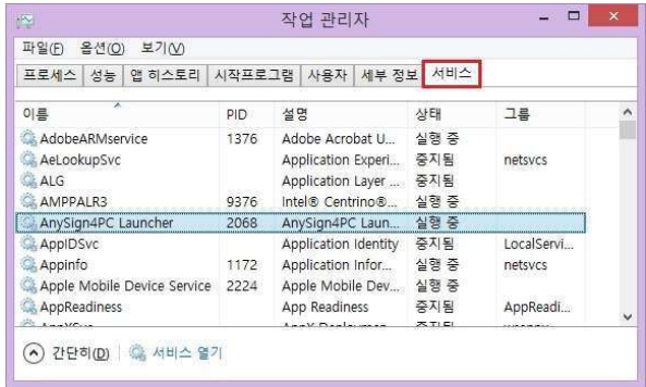
< 서비스 정상 >